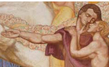
Fresque d'Emile Flamant Hôtel de Ville de Cambrai