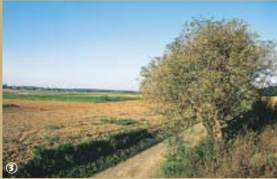
Levez les yeux vers le ciel, l'alouette n'est pas loin

Connaissez-vous un petit oiseau au plumage rayé, à dominante brune et au ventre blanc, réputé pour son impressionnante parade en vol ? Non ? Pourtant, vous l'avez plumé en chanson toute votre enfance... Ca y est, la mémoire vous revient, il s'agit bien sûr de l'alouette, et plus particulièrement de l'alouette des champs.