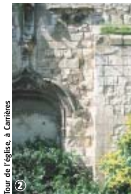
Tour de l'église, à Carnières

Dans un paysage agricole, vallonné, l'itinéraire relie deux tours fortifiées des 15 e et 16 e siècles. Ce parcours est sans difficultés et sera mieux apprécié de mars à octobre. Prudence en traversant les RD 118 et 97. En période de pluie, certains chemins boueux nécessitent le port de chaussures étanches.