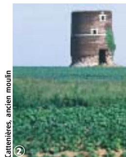
Cattenières, ancien moulin