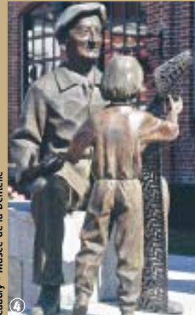
Caudry - Musée de la Dentelle

d'observer certaines habitudes traditionnelles. C'est ainsi qu'à l'heure du déjeuner, les tisseurs en cave se regroupaient par quartier au pignon d'une maison afin de lier conversation tout en mangeant un œuf battu dans un morceau de pain rond évidé. Cette pause d'une demi-heure permettait la diffusion des nouvelles et constituait une détente appréciée par tous. C'était l'instant béni où certains roulaient une cigarette tandis que d'autres bourraient une pipe.