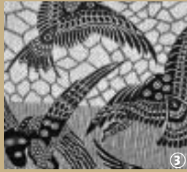
Caudry - Musée de la Dentelle

L'industrie textile, notamment celle du lin, occupait une place prépondérante dans le département du Nord. C'était alors une activité prospère qui faisait vivre de nombreux corps de métiers, entre autre fileuse, ourdisseuse, blanchisseuse et mulquinier... Ce tisseur à la main dont l'outil de travail, de fabrication artisanale, se trouvait