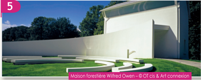
Maison forestière Wilfred Owen