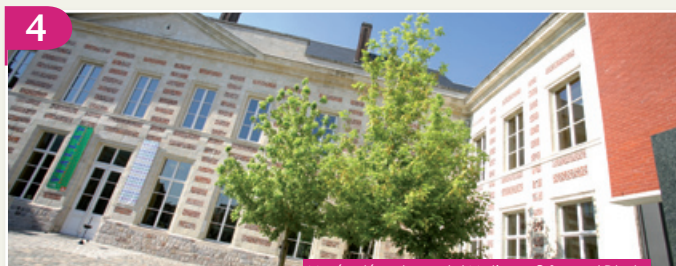
Musée départemental Matisse