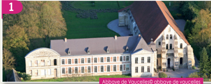
Abbaye de Vaucelles