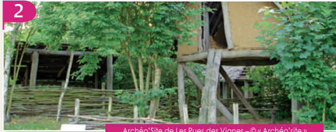
Archéo'Site de Les Rues des Vignes - © « Archéo'site »