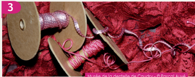
Musée de la dentelle de Caudry