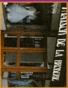
Maison de la Broderie Villers-Outréaux

Ouverture : semaine > 9h-12h/14h-17h week-end > 14h30-18h