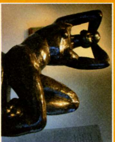
Musée Départemental Matisse Le Cateau Cambresis