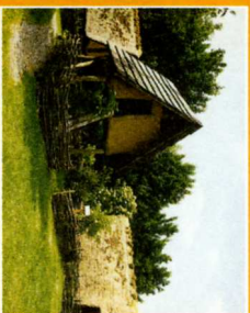
Archéosite - Les Rues des Vignes