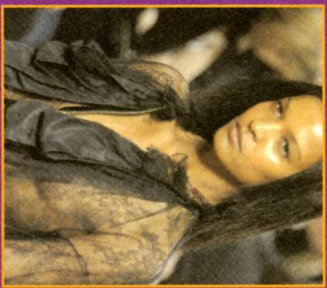
Un monde de création...