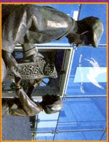
Musée Caudrésien des Dentelles et Broderies