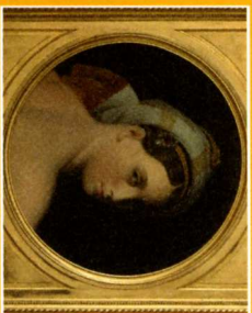
Musée des Beaux-Arts de Cambrai