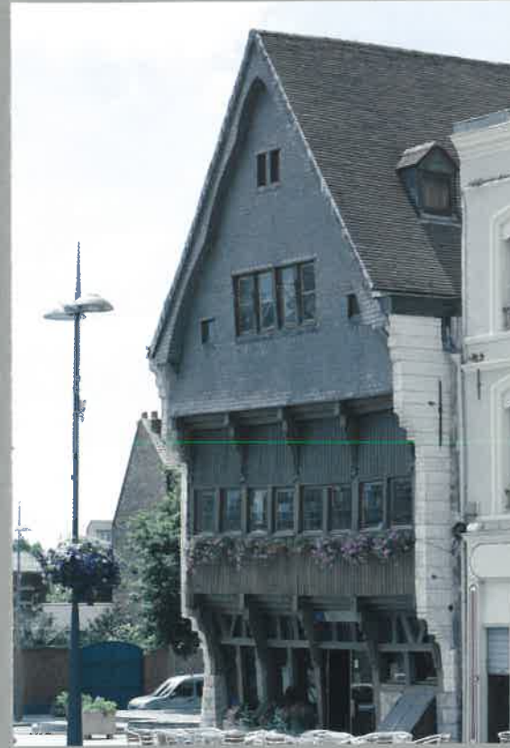
La Maison Espagnole Construite en 1595 durant l'occupation espagnole, d'où son nom, cette maison à pans de bois et pignon sur rue est le dernier exemple de ce type de construction très répandu au Moyen Âge jusqu'au XVII e siècle. Elle abrite aujourd'hui l'office de tourisme.