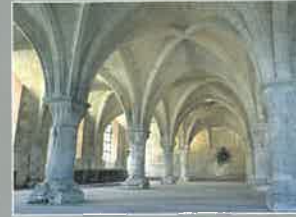
Abbaye de Vaucelles Les Rues des Vignes (14 km)