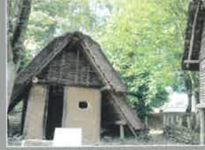
Archéo'site Les Rues des Vignes (14 km)