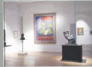
Musée départemental Matisse Le Cateau-Cambrésis (25 km)