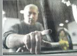
Musée des Dentelles et Broderies Caudry (14 km)