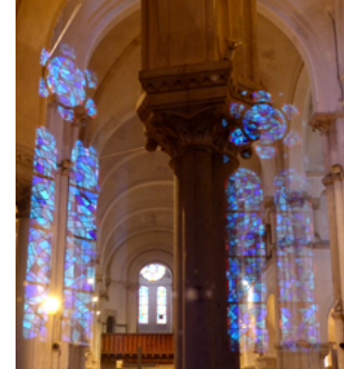
La tentation de saint Druon Église Saint-Druon