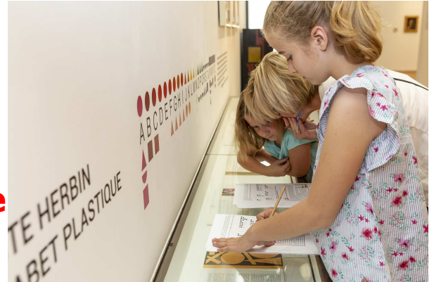
Vue du musée Matisse, jeu cluedo

JOURNÉES EUROPÉENNES DU PATRIMOINE JOURNÉES EUROPÉENNES DU PATRIMOINE