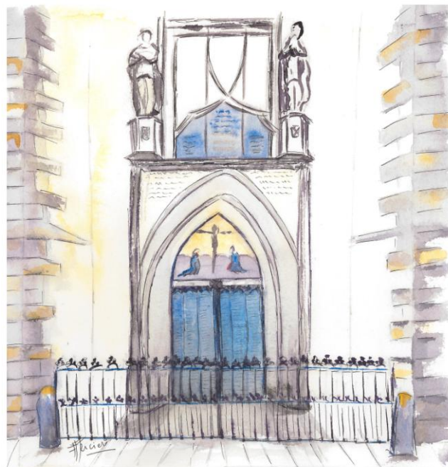
Porte de Wittenberg où auraient été affichées les 95 thèses de Luther

Ces convictions ne sont pas nouvelles. On les résume parfois d'un slogan : Sola fide (la foi seule), Sola scriptura , (l'Écriture seule), ou d'une formule : sacerdoce universel des croyants (égalité et responsabilité commune entre pasteurs et laïcs)... Nous les croyons d'une pertinence inégalée aujourd'hui.