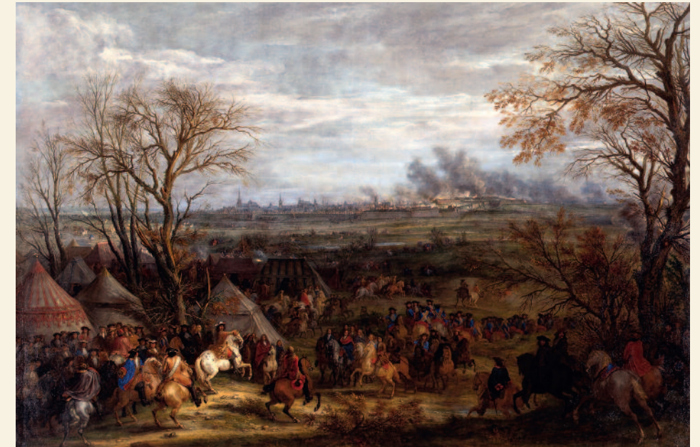
Adam Van der Meulen, Prise de Cambrai par Louis XIV , le 5 avril 1677. Huile sur toile. Musée des Beaux-Arts, Cambrai.

de Condé et Bouchain en 1676, puis de Valenciennes en mars 1677, est alors engagé le siège de la cité par une impressionnante armée de 12 000 hommes - contre 4 000 côté espagnol - conduite par le roi accompagné de ses principaux maréchaux et de Vauban. La ville capitule le 5 avril. La garnison, réfugiée dans la citadelle se rend le 17 après 29 jours de siège. Le surlendemain, le roi fait son entrée dans Cambrai. L'année suivante, le traité de Nimègue ratifie une conquête qui ne sera plus remise en cause par la suite.