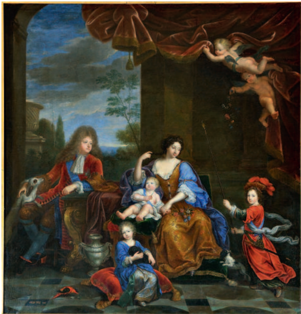
Mignard Pierre, La Famille de Louis de France fils de Louis XIV, dit le "Grand Dauphin", en 1687. Le Dauphin, marié à Marie de Bavière, a 3 fils. Louis, duc de Bourgogne, à droite sur le tableau, est âgé de 5 ans. Philippe, le futur roi d'Espagne Philippe V, assis près de sa mère, a 4 ans. Charles est un bébé d'un an. Huile sur toile, XVII e siècle. Châteaux de Versailles.