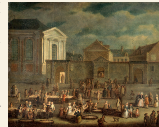
Achille Durieux, Maisons place du marché . Estampe. XIX e siècle. Musée des beaux-Arts, Cambrai

La conquête française ouvre une nouvelle ère pour Cambrai. De place forte stratégique, enjeu territorial et politique entre les puissances européennes, elle est désormais une ville du royaume de France, intégrée à la deuxième ligne du pré carré de Vauban. Le bouleversement ne se traduit pas uniquement en terme de souveraineté, il est également profondément culturel. L'influence française va progressivement se répandre à différents niveaux de la société, notamment par l'intermédiaire des élites et des dignitaires placés aux postes-clés, tels Barthélémy de Gélas, chevalier de Cesen, gouverneur de la ville, ou encore Fénelon sur le siège épiscopal. La centralité de la monarchie absolue du Roi-Soleil gagne ainsi peu à peu le fonctionnement des institutions, tandis que la physionomie de la cité est marquée par la diffusion de l'urbanisme et de l'architecture à la française.