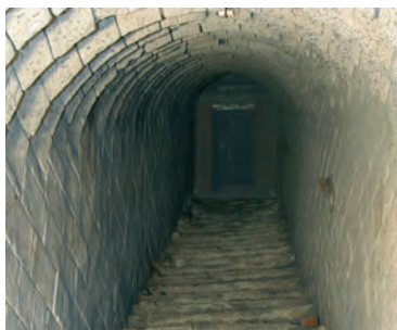
Souterrain de la citadelle

Une découverte ludique et originale à la citadelle, avec un circuit libre d'un kilomètre de galeries qui vous ramènera en 1677, lors du siège de Cambrai par Louis XIV. Spectacle sonore et visuel. 7/3,5€