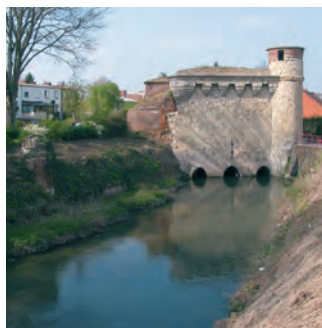
La tour des Arquets

Cette année, nous vous proposons un jeu de piste grandeur nature, où les anciennes fortifications deviennent un terrain de jeu et de découverte !