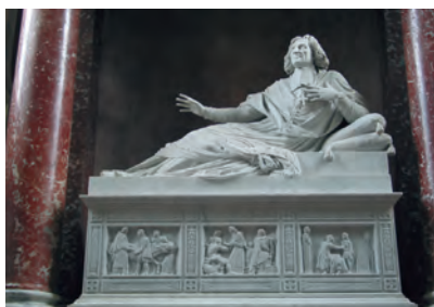
Le tombeau de Fénelon

Du 18 février au 15 mai 2012, le Centre Pompidou Mobile pose son chapiteau place de la République. Profitez-en, avant ou après votre visite, pour compléter votre découverte côté patrimoine !