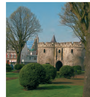
La porte de Paris

Samedi 28 et dimanche 29 avril, inscriptions et programme à partir du 10 avril à l'office de tourisme