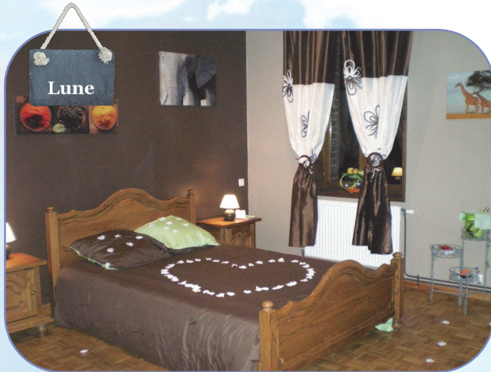
Classique et élégante — Douche et WC privés