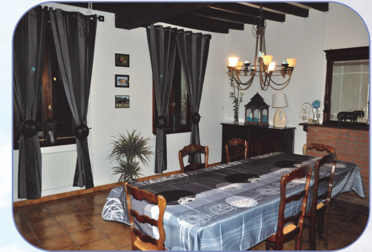
La table d'hôtes — Petits déjeuners et repas