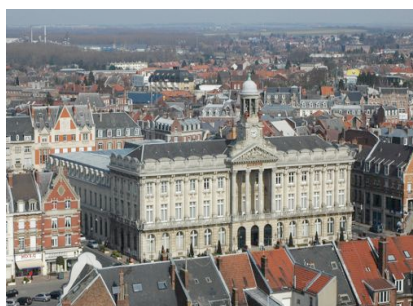
l'Hôtel de Ville