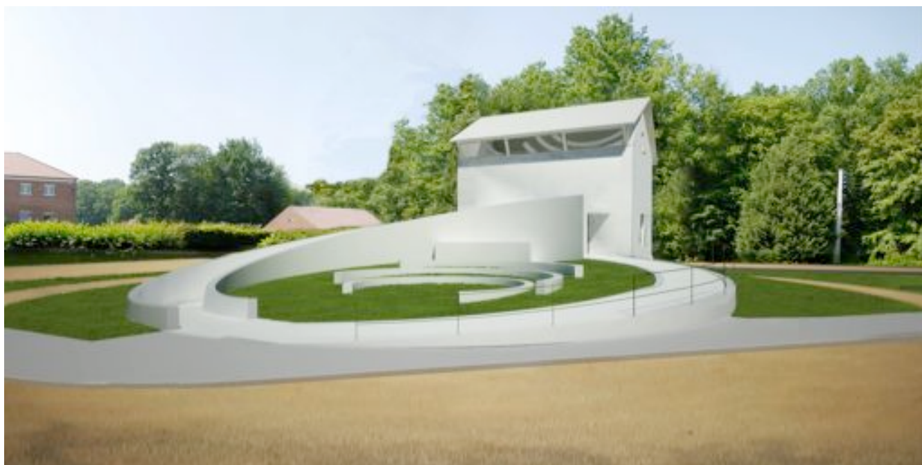
Perspective projet, La Maison Forestière Wilfred Owen © Simon Patterson

Inauguration le samedi 1 er octobre 2011 à 16h30