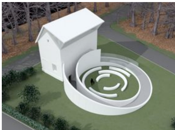
Simulation, projet de la maison forestière, © Simon Patterson