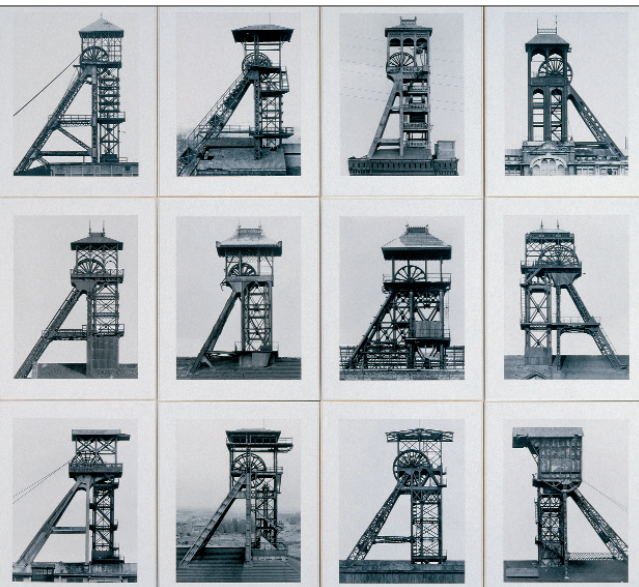
Bernd et Hilla Becher – 12 chevalements, 1971-1979. Coll. FRAC Nord - Pas-de-Calais.

du 7 au 31 janvier 2008 du lundi au samedi matin sur RDV, fermé pendant les vacances scolaires.