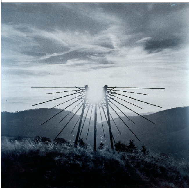
Nils-Udo – Sculpture de soleil, 197.9 Coll. du Frac Nord - Pas-de-Calais.

L'artiste et photographe Nils-Udo élabore des constructions à la fois simples, fragiles et délicates qu'il érige et photographie dans le milieu naturel. Réalisées à partir d'éléments empruntés au paysage, ces structures évoquent tantôt quelque architecture primitive tantôt le nid protecteur. De ce travail en prise directe avec les éléments naturels, en résultent des images calmes et silencieuses propices à la contemplation.