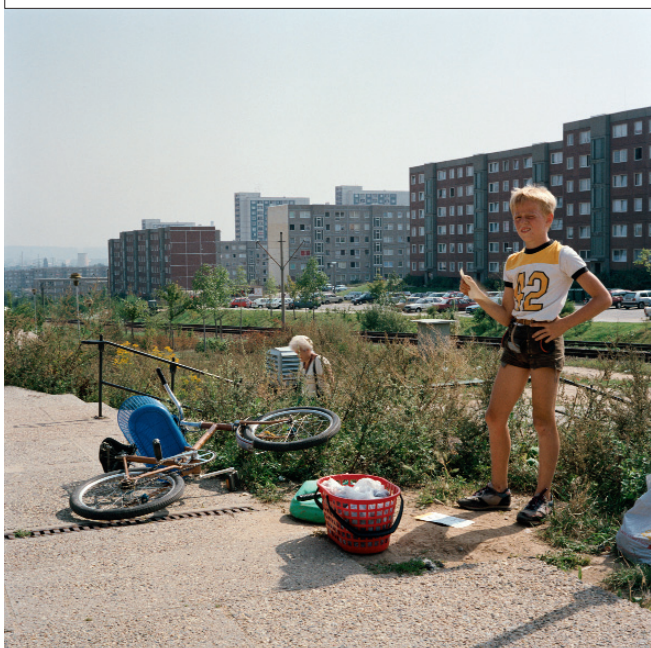
Yveline Loiseur – Les villes invisibles : Dresde, 2002.

Les Rencontres proposent à la Maison Falleur une exposition thématique sur le territoire urbain allemand après la chute du Mur. Constituée d'une vidéo et d'une cinquantaine de photographies, dont certaines sont montrées pour la première fois, cette exposition donne l'occasion de s'attarder plus particulièrement sur deux lieux emblématiques et singuliers de l'ex-Allemagne de l'Est, à savoir la ville de Dresde, ancien joyau de la Saxe réduit à l'état de ruine sous le feu des bombardiers anglo-américains en 1945, et l'ancienne piscine olympique de Berlin-est, haut lieu du sport est-allemand, laissée à l'abandon après la réunification, aujourd'hui détruite.