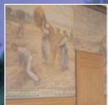
Solesmes : décors peints.