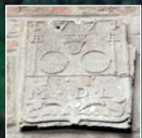
Solesmes : pierre gravée.

Solesmes où les grands décors peints de l'Hôtel de ville A , caractéristiques de la IIIème République, peuvent être assimilés à un livre d'images narrant la vie au début du XXème siècle (s'adresser à la mairie aux heures d'ouverture).