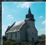
Sommailing-sur-Ecaillon : église XVIème-XVIIème s.