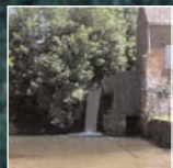
Escarmain : chute d'eau et son moulin.