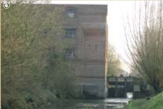
Ancien moulin - Sautzroi

Dans le second, seule papeterie du Hainaut jusqu'au 19 e siècle, on employait 11 ouvriers qui produisaient 12 espèces différentes de papiers. Transformé en moulin à farine en 1841, il servit à fournir de l'électricité de 1922 à 1950. Ce moulin aura donc exercé plusieurs métiers en 2 siècles, fournissant successivement de l'huile, du papier, de la farine et de l'électricité... Encore vivants ou éteints, tous en la Selle ont su trouver l'énergie qui les faisait tourner !