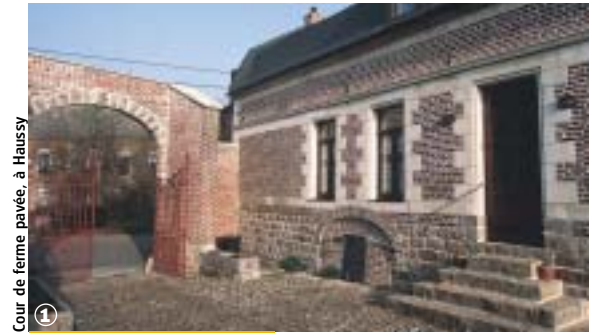
Cour de ferme pavée, à Haussy