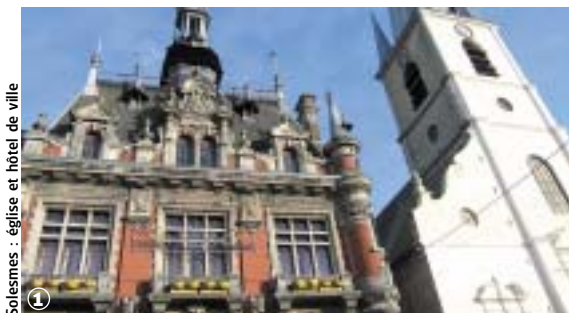
Solesmes : église et hôtel de ville

Randonnée Pédestre Au Pays de Barbari : 10 km