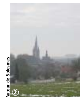
Autour de Solesmes