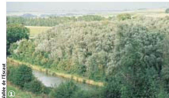
Vallée de l'Escaut

Banteux, Bantouzelle, Honnecourt-sur-Escaut (8 km - 2 h 00 à 2 h 40)