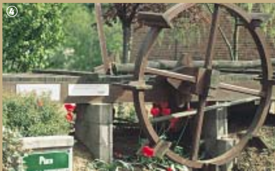
Scie hydraulique à Honnecourt-sur-Escaut

traitent pas seulement de l'édification des cathédrales mais plus généralement, des techniques de construction de l'époque. A travers ses écrits, Villard de Honnecourt nous éclaire encore aujourd'hui sur l'architecture gothique et ses impressionnantes dimensions. Il est d'ailleurs comparé, pour ses travaux, au plus célèbre Léonard de Vinci, pourtant né après lui ! La Bibliothèque nationale conserve son « Carnet » de 66 planches, contenant schémas, esquisses et plans d'une exactitude remarquable des cathédrales de Reims, Vaucelles ou Cambrai ainsi que leurs motifs décoratifs. Sa scie hydraulique a été reconstituée et trône fièrement sur la place du village comme un hommage à ce génie resté dans l'ombre.