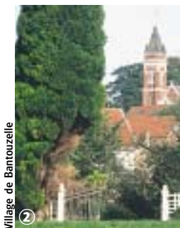
Village de Bantouzelle

Ce circuit familial, qui ravira les amoureux de nature, part également sur les traces d'un génial personnage : Villard de Honnecourt. Prudence en traversant et le long de la RD 103.