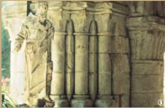
3 Abbaye de Vaucelles

Du culte à la culture, une admirable reconversion.