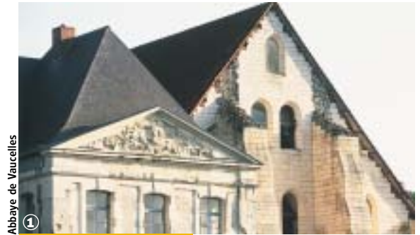
1 Abbaye de Vaucelles

Banteux, Bantouzelle, Les-Rues-des-Vignes (12 km - 3 h 00 à 4 h 00)