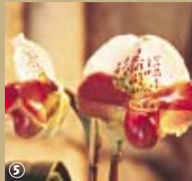
5 Expo d'orchidées à l'Abbaye de Vaucelles

Ainsi, restaurée depuis 1971, Notre Dame de Vaucelles se visite bien sûr et sert d'écrin à de nombreuses manifestations artistiques et culturelles, dont notamment une exposition internationale d'orchidées.