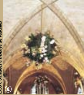
4 Expo d'orchidées à l'Abbaye de Vaucelles

Elle propose des produits tels que bière, fromage, miel et bonbons, tout cela au profit de sa réhabilitation. Mais ce n'est pas tout, elle vous accueille également pour des cocktails, des concerts privés ainsi que pour des mariages ! Alors si vous n'êtes pas encore mariés et que vous rêvez de convoler en justes noces dans un cadre digne d'une union princière, c'est possible... à l'Abbaye de Vaucelles !