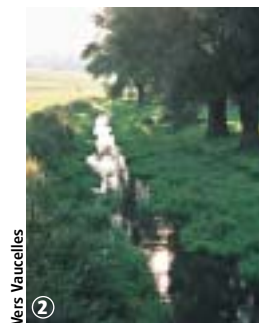
2 Vers Vaucelles