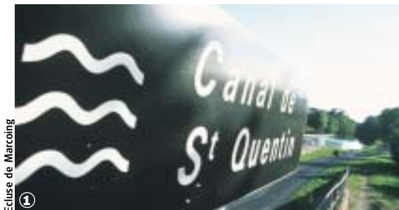
Ecluse de Marcoing

Noyelles-sur-Escaut, Marcoing (10 km - 2 h 30 à 3 h 20)