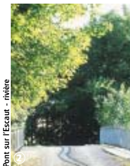
Pont sur l'Escaut - rivière