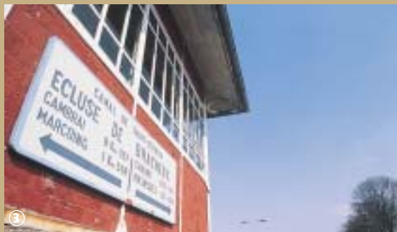
Canal de Saint-Quentin

La construction du canal de Saint-Quentin, reliant la Somme, l'Escaut et l'Oise, fut étudiée dès 1721. Les travaux, entrepris après la Révolution française, furent presque entièrement réalisés par des déserteurs condamnés et des prisonniers de guerre majoritairement espagnols.