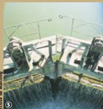
Ecluse de Marcoing

En 1916, le canal devint un abri sûr pour les allemands qui mirent en place la ligne Hindenburg et bouchèrent le souterrain à ses 2