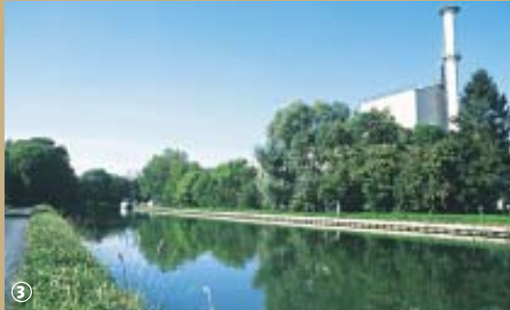
Canal de Saint-Quentin à Masnières

Saviez-vous que l'invention du verre remonte à la plus haute antiquité ? Praticé tout d'abord par les Egyptiens, le soufflage du verre arriva ensuite en Europe où son industrie se développa vraiment au XVII e siècle. Transparent, dur, isolant, ce matériau qui résiste particulièrement bien au froid et à la chaleur extrêmes, sans se casser ni se dilater, est précieux !