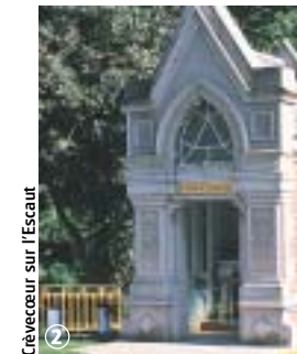
Crèvecœur sur l'Escaut