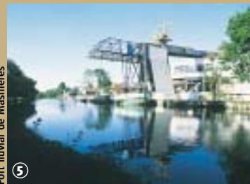
Port fluvial de Masnières

Universelle de Paris en 1855, l'autre à l'exposition de Rouen en 1859. Pendant la période précédant la guerre de 1870, la verrerie est prospère. Elle sera vendue à Jules Millet qui apportera le progrès, dans l'aménagement de l'installation et le perfectionnement de l'outillage. Pour faire face à la concurrence allemande, l'usine fera appel à de la main d'œuvre venue d'autres régions françaises ou étrangère. On y fabrique alors des bouteilles en tous genres et 600 ouvriers produisent 15 millions de pièces par an. En 1930, avec la création du four II équipé de machines automatiques très performantes, le travail mécanique chasse le travail à la main. Cette structure est le cœur battant de la ville puisque la quasi-totalité des habitants de la commune travaillent aujourd'hui encore à la fabrication de flacons de luxe pour la parfumerie ; précieux contenant pour un précieux contenu !