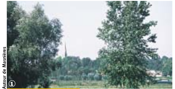
Autour de Masnières

Crèvecœur-sur-l'Escaut, Marcoing, Masnières, Rumilly-en-Cambrésis (15 km - 4 h 00 à 5 h 00)