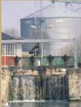
Canal de Saint-Quentin à Masnières

Saviez-vous que l'invention du verre remonte à la plus haute antiquité ? Praticé tout d'abord par les Egyptiens, le soufflage du verre arriva ensuite en Europe où son industrie se développa vraiment au XVII e siècle. Transparent, dur, isolant, ce matériau qui résiste particulièrement bien au froid et à la chaleur extrêmes, sans se casser ni se dilater, est précieux !