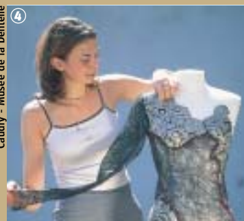
4 Caudry - Musée de la Dentelle