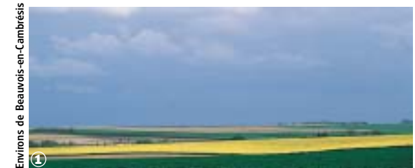
1 Environs de Beauvois-en-Cambrésis

Office National des Forêts : 03.27.30.35.70 ou 03.27.21.29.86.