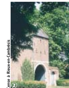
2 Cense à Rieux-en-Cambrésis

Entre Selle et Escaut, l'itinéraire traverse un plateau coupé de vallées et drapé de grandes surfaces cultivées. Les villes et villages présentent des fermes et un habitat caractéristique ainsi que des témoignages architecturaux ou muséographiques de l'activité textile. Ce parcours est sans difficulté, hormis les traversées de la RN 43 et de la RD 942. La gare de Caudry peut constituer un point de départ.