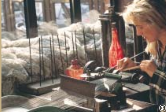
3 Caudry - Musée de la Dentelle

Au 19 e siècle, la fabrication de la dentelle s'est mécanisée, tout en gardant la finesse du travail fait main. Le musée de Caudry témoigne de ces fastes d'antan retraçant l'histoire de l'industrie dentellière dans un site qui a su garder l'atmosphère d'un véritable atelier du 19 e siècle en fonctionnement. La ville produit, sous le label « Dentelle de Calais », une dentelle de qualité, utilisée en Haute